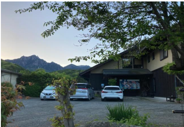
瑞牆山 (2,230m) と「五郎舎」