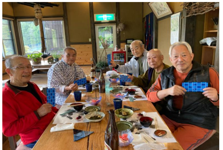
民宿「五郎舎」の食堂にて表彰式